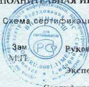
Схема сертификации - 3.