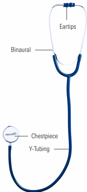
ДКМСИТФ Й жПШИМ